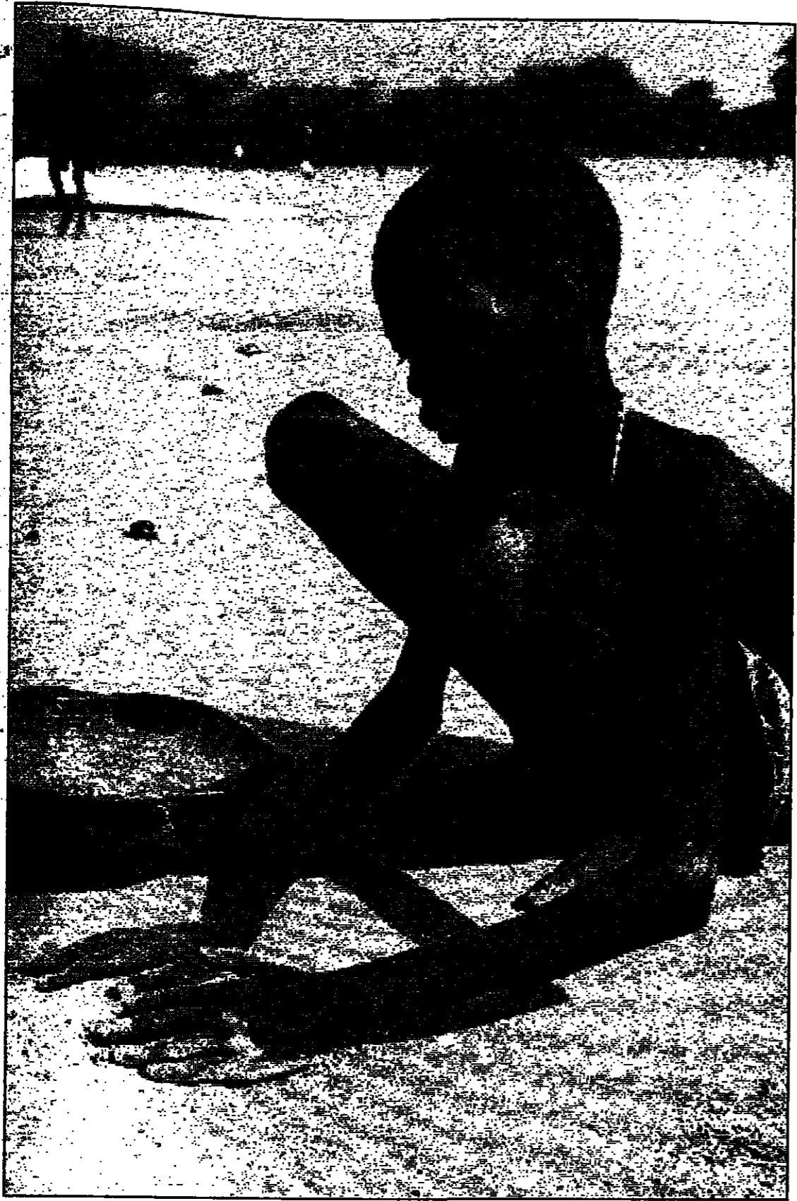
صبي سوداني يجوع جوعاً في الجنوب

يساور عمال الاغاثة اللق من ان اتفاق وقف إطلاق النار بين الحكومة والجيش الشعبي لتحرير السودان لن يوقف القتال بين الفئات التي تتخضع للسيطرة للباشرة للطرفين الرئيسيين. ويتحمل اللق الرئيسي في اعالي النيل حيث تسبب القتال بين اثنين من امراء الحرب المعتمدين من الخرطوم في تعثر توزيع اللواد الغذائية. ويقول عمال الاغاثة انه لم يتضح ايضا ان كان وقف اطلاق النار سوف يوقف الغارات المتكررة التي يشنها افراد من قبائل «الرحل» على قرى وبلدات في شمال بحر الغزال. وقال بياك ان القتال مستمر في اقليم النيل الأزرق الذي لا يشمل وقف اطلاق النار حيث شنت القوات الحكومية هجوماً على بلدة يسير عليها الجيش الشعبي لتحرير السودان. ومن المقرر عقد جولة جديدة من المحادثات بين الحكومة السودانية والجيش الشعبي لتحرير السودان في انيس ابايا عاصمة النويرا قبل. وتم التوصل الى وقف اطلاق النار